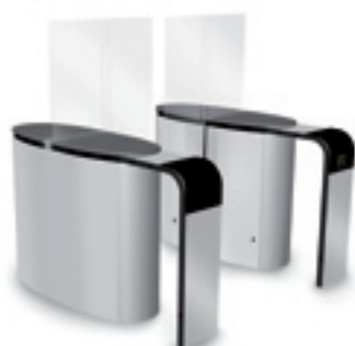
SmartLane 911 met uitgebreide toegangscontrole Afmetingen*: 1600 x 1800 mm (63" x 70 7/8 " )