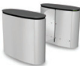
SmartLane 910 Afmetingen*: 1200 x 1800 mm (47" x 70 7/8 " )