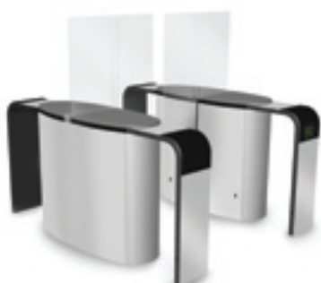
SmartLane 912 met uitgebreide toegangs-/ uitgangscntrole Afmetingen*: 2000 x 1800 mm (78 3/4 " x 70 7/8 " )