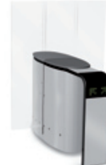
SmartLane 911 Twin met uitgebreide toegangscontrole en compacte afmetingen Afmetingen*: 1600 x 1450 mm (63" x 57")