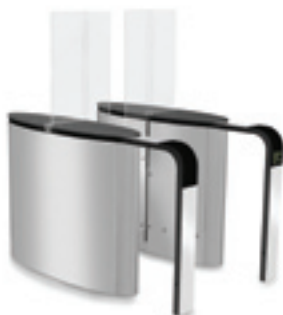
SmartLane 901 met uitgebreide toegangscontrole Afmetingen*: 1600 x 1200 mm (63" x 47")