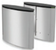
SmartLane 900 met compacte afmetingen Afmetingen*: 1200 x 1200 mm (47" x 47")