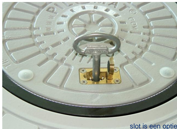
slot is een optie