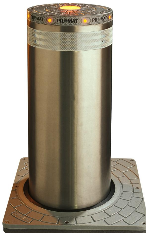
ME-275 (verlichting is een optie)